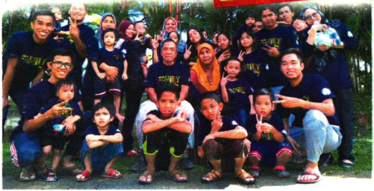
ISNIN bersama anak dan cucunya.